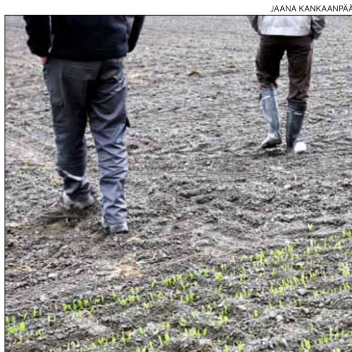
Luopumistuen kautta tehdään puolet maatalojen vuosittaisista sukupolvenvaihdoista.