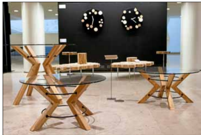
Woodism-työryhmän huonekaluja on nähtävillä Helsingin kaupungintalon Virka-galleriassa syyskuun alkuun asti.

Kun selvisi, että kyseessä on nainen, järkytys purkautui parhduksen: "Naispuuseppä!" Tämä tosin tuli korjattua salamannopeasti: "No, ei se mitään."