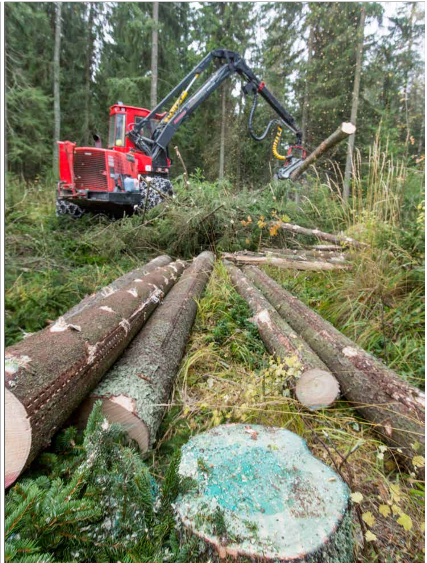
Kantokäsittely on toistaiseksi ainoa tapa ehkäistä tyvilahon leviämistä metsissä. Kuvassa hakataan kuusitukkia UPM:lle.

Koneviestin kestotilaajat ja Koneviestin sähköisten palvelujen tilaajat saavat kaiken sisällön kirjautumalla koneviesti.fi-sivustolle. Mikäli haluat tilata Koneviesti-lehden, näköislehden tai muut sähköiset palvelut voit tehdä sen osoitteessa: koneviesti.fi/tilaa