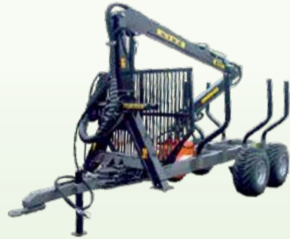
Kuormaimissa/kärryissä laaja yhteensopivuus