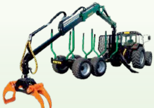
KIRE 850 kourakuormaaja 13.950 €