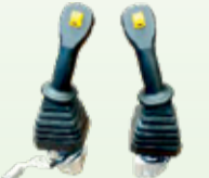
Useita venttiili vaihtoehtoja